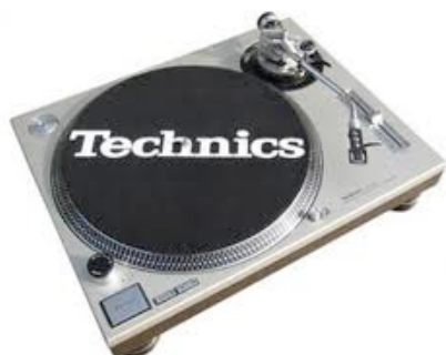
Platine SL1200MK2 CDJ 200