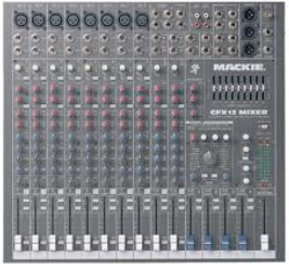
Console de mixage 12/16 Pistes (Type MackieCFX12)