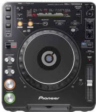
Platine CD Pioneer CDJ 1000MK3