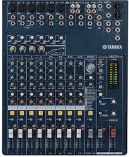
Console de mixage 8/10 Pistes (Type MG Yamaha)