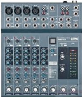
Console de mixage 4/6 Pistes (Type HPA M822FX)